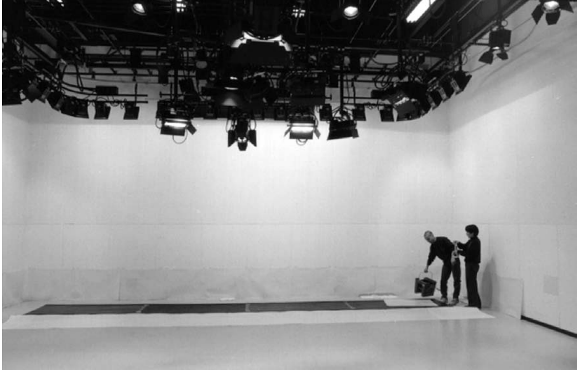
撮影風景。全身を黒塗りにし、アクロバット演技に臨む。